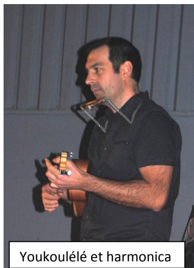
Youkoulélé et harmonica